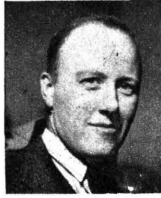
Professor Torgny T:son Segerstedt