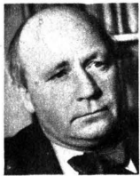
Professor Herbert Tingsten