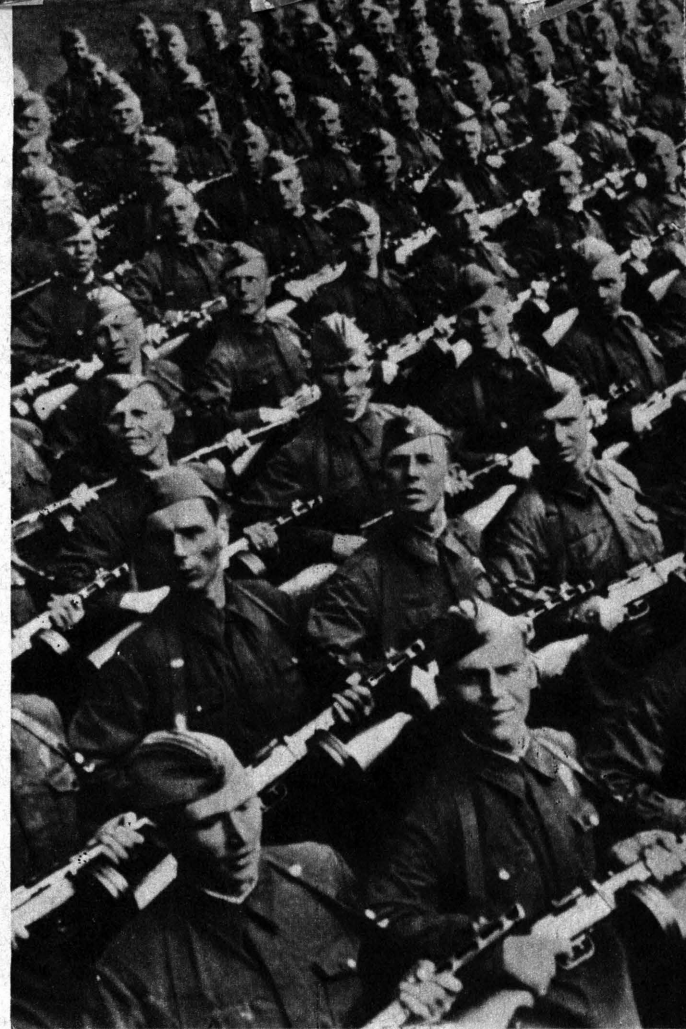
Röda armén består i regel av ur folkslagssynpunkt enhetligt sammansatta förband.