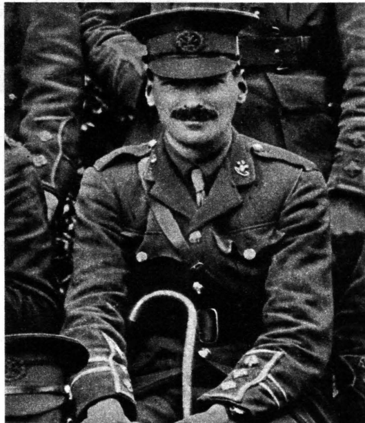
Attlee representerar mer än Churchill gentlemanen, men synes sakna förmåga att entusiasmera och elda.

De tre större partierna komma, utom möjligen i enstaka fall, att uppträda självständigt vid valen. Arbetarepartiets kongress beslöt, om också med knapp majoritet, att icke ånyo upptaga den vid tidigare kongresser avvisade tanken på en folkfront (progressive front), dvs. en valallians med de extrema vänsterpartierna, oberoende arbetarepartiet, Common Wealth och kommunisterna. Högern och arbetarepartiet beräknas tävla i praktiskt taget samtliga valkretsar, dvs. med omkring 600