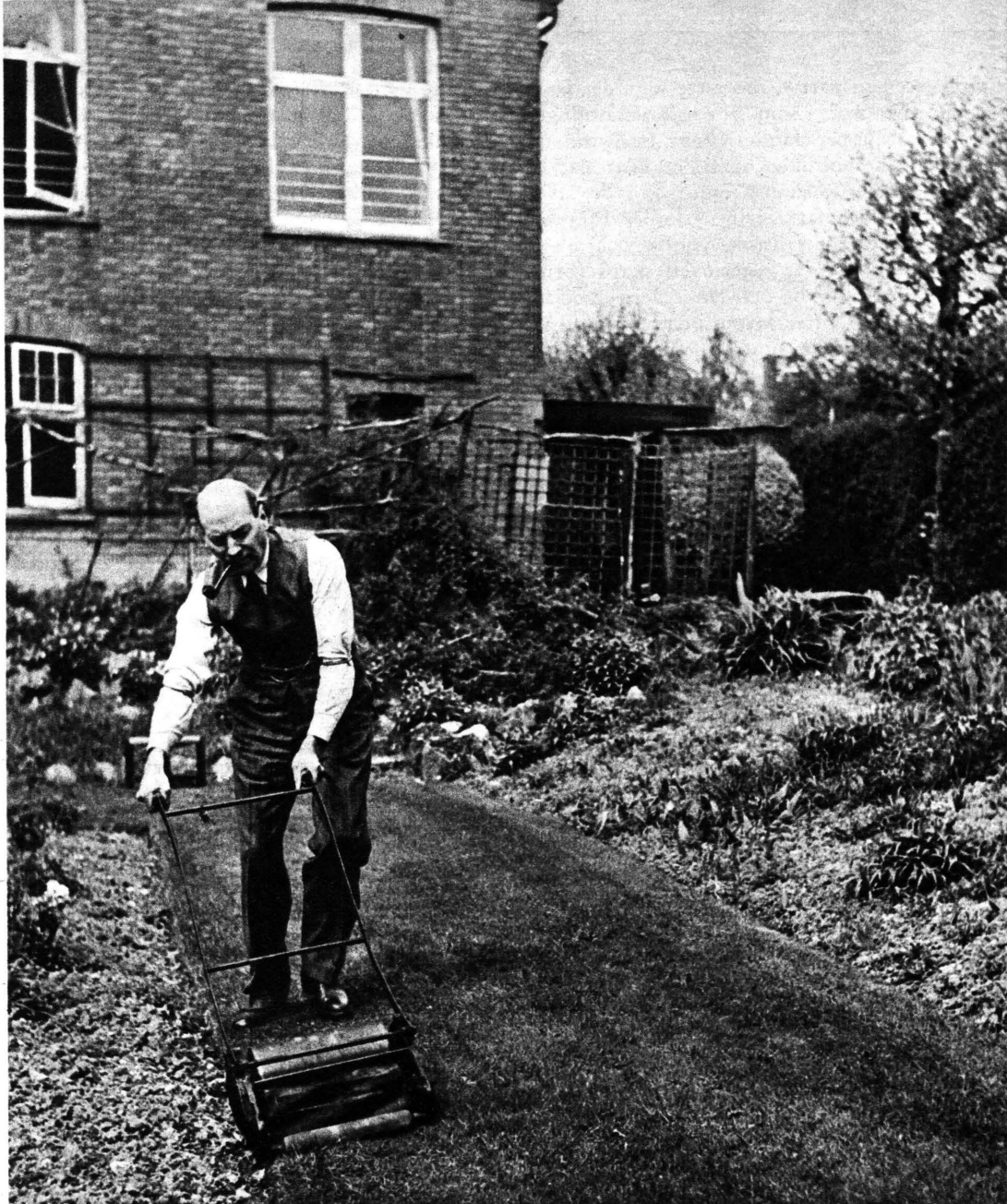
Typisk engelsman i typisk engelsk miljö: arbetarpartiets ledare Attlee klippar gräsmattor i sin trädgård.

De följande femton åren utmärkas av en småningom fortgående reorganisation av partiväsendet fram till ett nytt tvåpartisystem, med högern och arbetarpartiet såsom huvudmotståndare. Majoritetssystemet premierade de starkaste partierna och följden var, att valmanskåren, eftersom röster på det tillbakagående liberala partiet framstodo som bortkastade, allt bestämdare fördelade sig på högern och arbetarpartiet. Sedan Irland år 1922 fått självstyrelse, blev den irländska gruppen i parlamentet utan betydelse. Följande siffror rörande rest- och mandatfördelningen vid valen 1922—1929 belysa utvecklingen och visa de egendomliga resultat, till vilka majoritetssystemet vid valen kan leda.