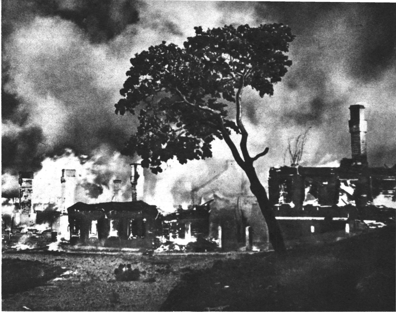
Förstörelsen under det gångna kriget överstiger trots sin oerhörda omfattning inte 1/5 av nationalförmögenheten och sannolikt torde den nationella förödelsen tämligen snart vara utplånad och ersatt.