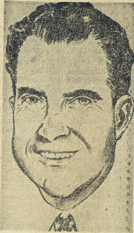
Om kvinnorna hade bestämt presidentvalet i USA 1960 hade Richard Nixon (bilden) segrat, skriver Herbert Tingsten i denna artikel om könsens roll i den amerikanska politiken.