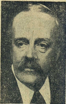
Arthur James Balfour som premiärminister 1903.

Parallellerna i de båda dignitärernas levnadslopp är i mycket slående. Rosebery (1847-1929) och Balfour (1848-1930) var idealtypiska representanter för den brittiska aristokrati för vilken politiken var ett spel, en hobby vid sidan av kapitalistens och godsägarens sysslor, mondäna förströelser, resor och läsning. Båda ärvde i myndighetsåldern stora förmögenheter, 200-300 miljoner kronor i nutida penningvärde; Rosebery blev tillika earl och — vilket han ansåg ha försvärat den politiska karriären — medlem av överhuset. Båda hade mera framstående gynnare att tacka för tidig och spektakulär framgång. Rosebery blev Gladstones adjun-