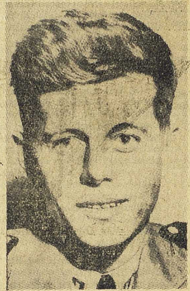
Löjtnant John F. Kennedy — befälhavare på motortorpedbåten PT 109.