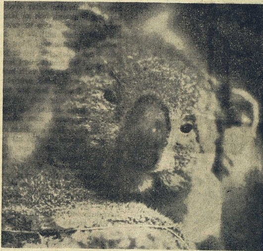
Koalan — "det fulländade djuret".

Den förtjusning i djur som jag lärde mig i barndomen i Kyrkhäm koncentrerades på katter. Den första katten, Pärilan, upptog mycket av min tid i sex-sjuårs-åldern. Mamma gjorde det till en princip, om också långt ifrån orucklig, att jag skulle skaffa katten mat genom metning. Då vi flyttade till Stockholm följde Pär-