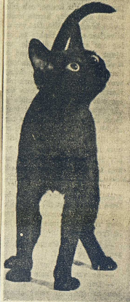
Katter har varit Tingstens favoritdjur — på bilden ovan en Burmakatt.