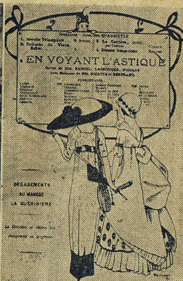
Under sin tid vid krigsskolan i Saint-Cyr uppträdde den unge de Gaulle också som skådespelare. På revyaffischen ovan finns hans namn med i rollföreteckningen. Till vänster en bild från föreställningen med de Gaulle som bybrudgum i bög batt.

ser mot tinnarna." I kapitlet om den militära ledarens karaktär förklaras att chefens stränghet och hårda fordringar ofta måste väcka irritation och kritik hos de underordnade under lugna tider. "Men då handlingens tid kommer tystnar kritiken. Viljorna, förhoppningarna dras till ledaren som järnspånen till magneten. När krisen kommer är det honom man följer, det är han som bär bördan på sina armar, även om de bryts av den." I förhållandet till sina överordnade är den som är kallad till chef inte böjlig och inställd på att behaga, han är likgiltig för rutin och formaliteter, han anses högmodig och odisciplinerad. Han finner "beslutet hos sig själv och inte i en order" och följer inte "den passiva lydningens bud". Lord Fisher hade rätt då han yttrade att "Jellicoe har alla Nelsons förtjänster utom en, han kan inte vägra att lyda". Mannen med karaktär, med förmåga att handla, våga och härska, står alltså över hierarkin, befällningarna, lagen; hans kallelse ger honom rätt att leda.