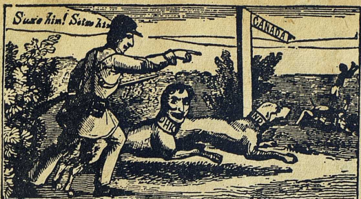
Jakten efter slavarerna som flydde med "den underjordiska järnvägen" till Kanada. Samtida teckning ur The Liberator.

stroken, de stilla och beskedliga, som inte visste något, inte ville blanda sig i världens affärer och inte kunde förbittras.