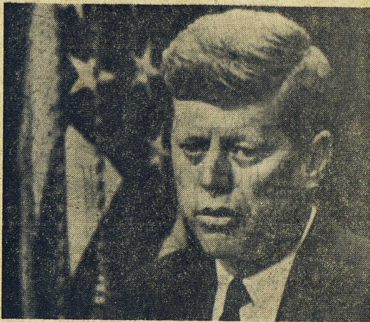
President Kennedys bok "Studier i mod", som nu föreligger i svensk översättning, anmäls här av Herbert Tingsten.

Dessa historiska skisser är väl gjorda, smyckade med goda anekdoter och citat och utformade med energi och temperament. Tonen blir ofta litet söndagsskolemässig, med de många moraliska klangfraserna och de ständiga uttrycken av beundran och förtjusning. Kennedy framträder med en eskort av respektabla radikala, i