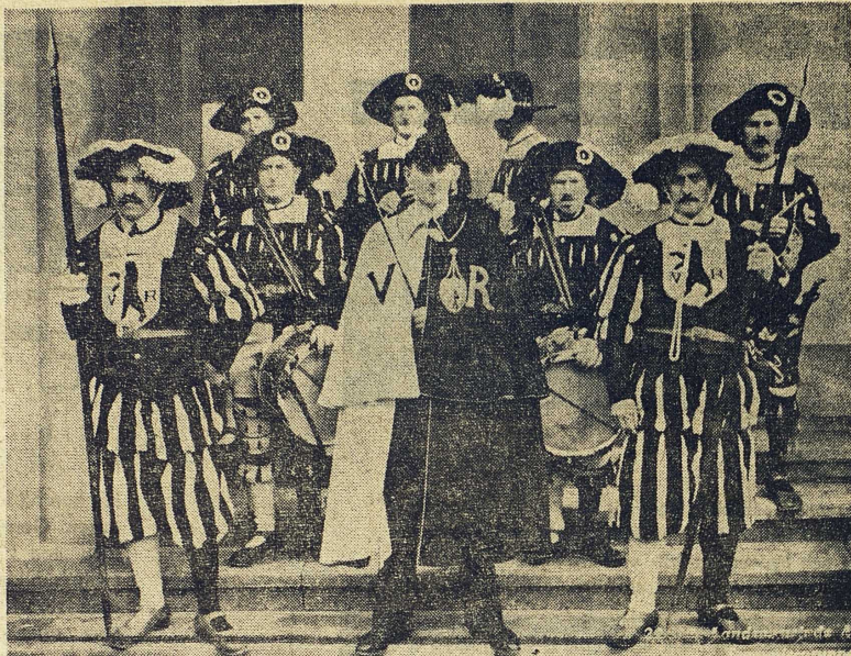
Politik och historieromantik i Schweiz: män i ålderdomliga dräkter vid ceremonierna i samband med den årliga medborgarriksdagen i kantonen Appenzel.

En synpunkt som visserligen framförts även på andra håll, men i Schweiz hävdas, med ovanlig energi, är att rösträtten och värn-