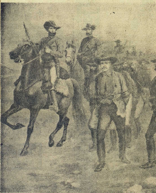
Fem dagar senare, tillfångatagen av boerna

Under de följande åren, med den engelska imperialismens kulmination i Sudankriget och boerkriget och utformningen av en ny maktkonstellation i Europa, blev problemet om Jamesons raid inaktuellt, även om det någon gång fördes på tal av förbittrade idealister i underhuset och anglofober utanför England.