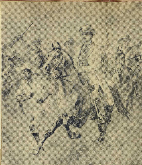
Jameson rider ut från Pitsani.

I regel godtog den engelska pressen kommissionens frikännande utslag. Några tidningar gjorde dock ironiska anmärkningar, och privat uttalade åtskilliga politiker att utredningen tydligen avsett att rentvå, inte att klarlägga. Särskilt i den franska pressen angreps undersökningen som ett genomfört bedrägeri; Le Temps skrev att den betecknade "en triumf för statsmannen från Birmingham, men tillika det brittiska samvetets abdikation".