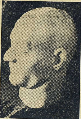
Stråtrövaren Ned Kellys dödsmask, förvarad på anatomiska institutet i Canberra.

Jordbrukarna — för att begagna detta sammanfattande uttryck — har också av andra skäl en särskild prestige. De var under årtiondena före demokratiseringen en härskande klass, och de har fortfarande i flera stater politiska företrädesrättigheter genom rösträttsbestämmelser och valkretsindelning. Ekonomiskt och socialt bildar en del av jordbrukarna den mest markerade överklassgruppen i Australien. Av de 250 000 självägande jordbrukarna kan ungefär 10 000 betecknas som godsägare, med tusentals hektar odlad mark eller betesmark. De flesta inom denna grupp är fårodare, ofta med områden på 10 000—20 000 hektar och tiotusentals får. Dessa "station-owners", med "homesteads" påminnande om lyxvillor eller moderniserade herrgårdar, är Australiens närmaste motsvarig-