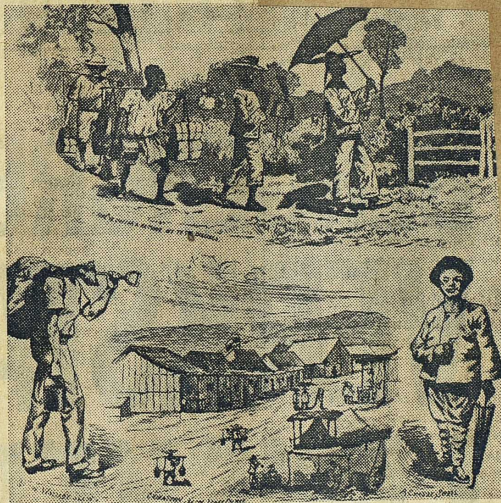
"Gula" i Queensland på 1870-talet.

Den invandringslagstiftning som antogs av det första australiska