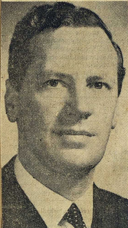
Den australiske invandringsministern AR Downer.

arbetsmarknaden. Klart är dock att en sådan fruktan rimligen måste kombineras med rasfördomar, och debatterna omkring 1900 visar tydligt att förbuds lagarna beslöts i rasföraktets och rashatets tecken. Huvudfrågan var, yttrade ar-