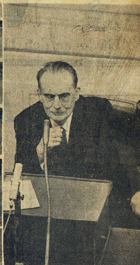
Det holländska arbetarpartiets gruppleddare i andra kammaren, J A W Burger, i talarstolen under en debatt samt, bilden t h, partiets regeringschef, Willem Drees.

kommande regeringsförslagen. I andra lägen kan man inte närmare än en allmän och lös överenskommelse — ungefär motsvarande en svensk koalitionsregeringsförklaring — och då anses i princip regeringen inte vara riktigt "parlamentarisk". Den sålunda bildade regeringen, delvis rekryterad i, delvis utanför representationen, tenderar enligt samstämmiga vittnesbörd att bli en enhet, inom vilken partiskilnaderna spelar ringa roll. De mera samarbetsvilliga inom partierna ingår i regeringen, denna känner sig tvungen att nå uppgörelser, i regel trivs man så bra med varann att slitningarna reduceras till ett minimum. Några gånger om året avgörs frågor genom omröstning inom kabinettet, ofta oberoende av partilinjer; de som kommer i minoritet stannar i regel kvar och opponerar då aldrig i kammaren mot regeringsbeslutet. I många fall vet inte ett partis parlamentsfraktion vilken ställning partiets ministrar intagit i regeringen i en viss fråga. Vanligen uttrar sig ministrarna i representationen blott i departementsfrågor, och detta underlättar solidaritetsprincipens tillämpning. Härtill kommer att, liksom i Sverige, förslag om misstroendevota inte