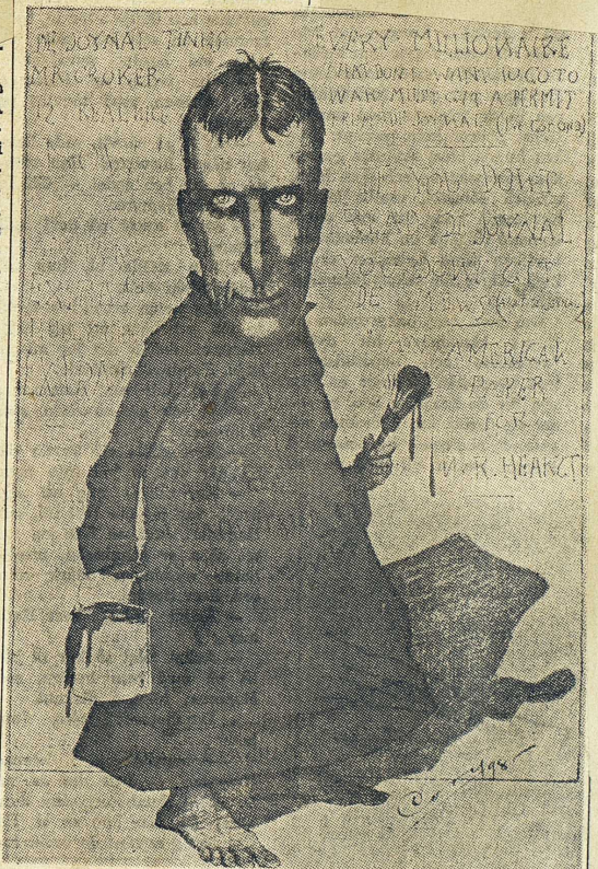
En amerikansk karikatyr från 1898 över William Hearst och hans "gula press", som tillhörde de drivande krafterna i krigspropagandan.