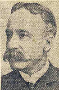
Amiral George Dewey.

pi? Expansionisterna segrade, och rättfärdighetsfrågan förvisades snart till arkivens dunkel. Försvaret för vad som skedde var och förblev hänvisningar till det "uppenbara öde" (manifest destiny) som drev den civiliserade och aktiva amerikanska nationen att bli kontinentens behärskare samt den mera realistiska och hållbara synpunkten att denna kontinent