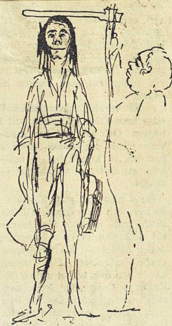
General Wolfe mäts av sin adjutant, som kommenterar: "Längre än någonsin! Vår general börjar sin dag." Karikatyr av Wolfe's brigadgeneral Townshend.

Under månader låg den lilla engelska armén utanför Quebec utan att vinna några framgångar av betydelse. Wolfe ständiga tanke var att locka de franska styrkorna — till stor del skogslöpare och indianer — att våga strid på öppna