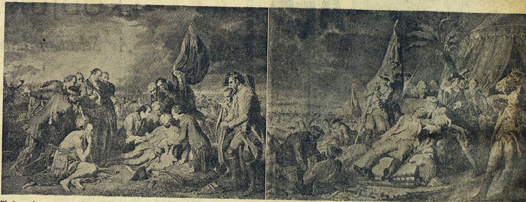
Två tavlor som visar hur legenden om segern vid Quebec utformades. Till vänster Benjamin Wests framställning av den döende general Wolfe, omgiven av officerare, fana och en indian. Till höger markis de Montcalms död, efter Watteau, med motsvarande romantisk utsmyckning.

Med anknäpning till en rad nyttigvna arbeten i ämnet skriver Herbert Tingsten här om det ryktbara slaget mellan engelsmän och fransmän i Quebec, som ägde rum i dag för tvåhundra år sedan.