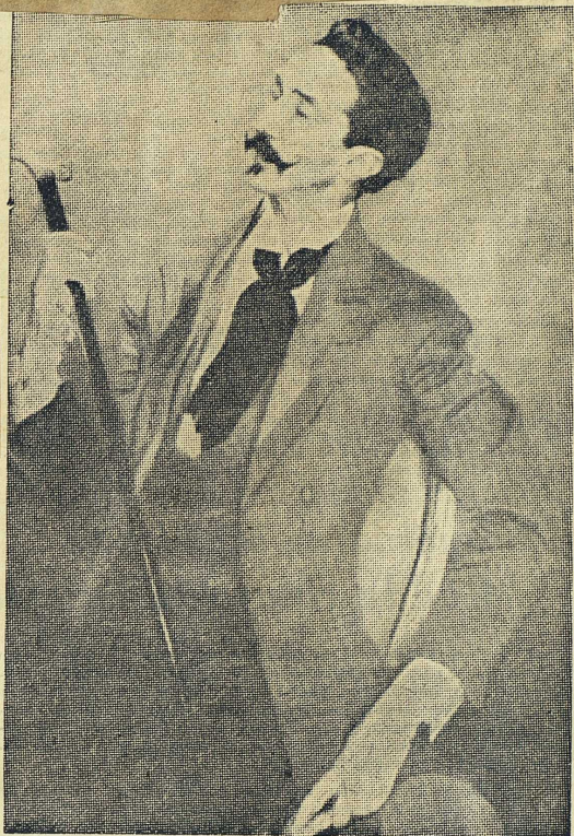
Greve Robert de Montesquieu, en av Prousts förebilder till baron de Charlus.

Dessa förbluffande anspråk torde i huvudsak vara välgrundade. Painter beskriver Prousts liv mer ingående än någon annan författare; han lämnar också nya och viktiga bidrag till den redan omfattande litteraturen om förebilderna till Prousts romanfigurer. En ofrånkomlig svaghet är att biografien i så stor omfattning bygger på brev; därmed följer att Prousts relationer till vänner och mondana bekanta ofta blir säkrare och klarare belysta än hans förhållande till sina närmaste, främst modern och fadern. Painter ger också perspektiv på Proust och hans idéer, i flera fall högst tveklaktiga perspektiv, men de framförs med en lidelse och en sinnrikhet som kommer läsaren att ännu en gång