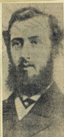
William Winwood Reade.

sällan hans namn. Beatrice Webb och H G Wells talar om honom med beundran. Nya upplagor av boken utgavs flera gånger, så 1910 och 1934. Att Reade var fritänkare betonas starkt då han omnämnes, och möjligen är detta orsaken till att hans idéer från början kom i skymundan; typiskt är att förordet till bokens senaste upplaga skrevs av "rationalisten" J M Robertson, som betygar att Reade trots sin ringa berömmelse har haft stort inflytande. Det är emellertid inte Reades ateism, utan hans darwinistiska framstegslära som främst gör honom idéhistoriskt intressant.