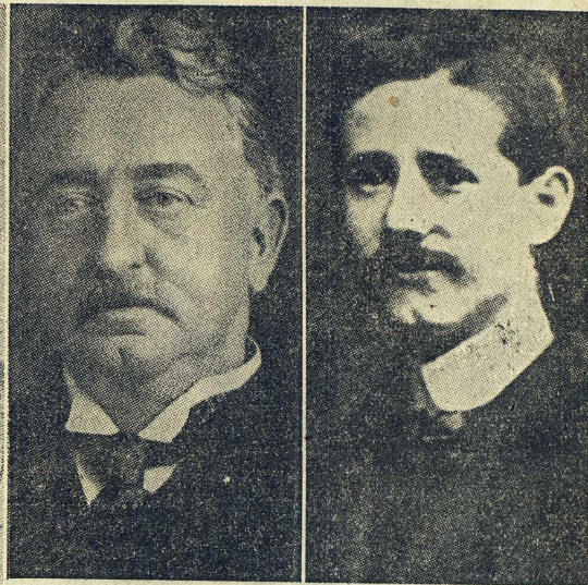
Till vänster en målning av Harry Johnston föreställande en sikh-soldat på post vid Fort Johnston. Uniformen i svart, gult och vitt hade Johnston själv komponerat som en symbol för det goda förhållandet mellan de olika raserna. — Bilderna i mitten och till höger: Cecil Rhodes och Harry Johnston.

nyss erövrade besittningarna i Afrika. Men självstyrelsens ideal ansågs ligga så långt borta att det snarare smyckade än motive- rade imperialismen. Målet var nästan lika drömligt och avlägset som frihetens rike för den kommunistiska diktaturens teoretiker, och dilemmat blev därför ännu inte en inre konflikt.