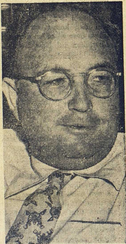
Senator JAMES EASTLAND — hävdar att högsta domstolens utslag mot rasdiskrimineringen dikteras av påtryckningsgrupper "som verkar för att undergräva det amerikanska statskicket och bastardisera den vita rasen".