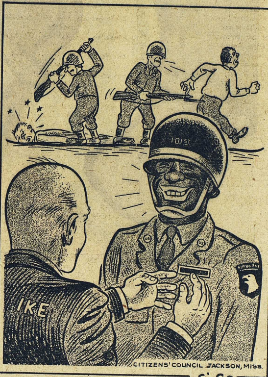
CITIZENS' COUNCIL JACKSON, MISS.

Man kan sätta kläder på en chimpanzé, göra honom rumsren, lära honom att begagna gaffel och kniv, men det behövs en utveck-