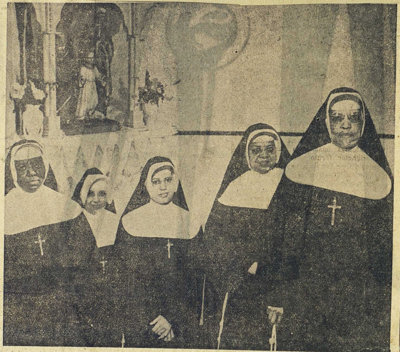
Rasfrågan löst i fridens tecken: nunnor tillhörande en orden i det starkt katolska New Orleans.

Sedan några år före inbördeskriget var demokraterna under ett långt skede i första rummet ett