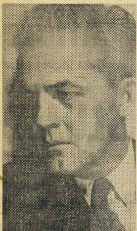
William Alexander Percy.

"De fattiga vita, dessa hetsiga och obildade vita, som vi ägnar den bästa delen av vårt liv att disciplinera och uppfostra" — Percy finner inte ord nog starka att uttrycka sin avsky och sin distans. Dessa vita var kanske ursprungligen av gott virke — de var ju av anglosaxisk härkomst — men "fattigdomens, svältens och ingiftets baciller har utfört sitt förstörande verk; för närvarande finns nog inte något mera obehagligt på jordens yta. Jag vet att de har äran av de enda amerikanska folksångerna, av väckelsemötena, av en ny och utmärkt skola i amerikansk litteratur. Jag kan förlåta dem som Gud förlåter, men be-