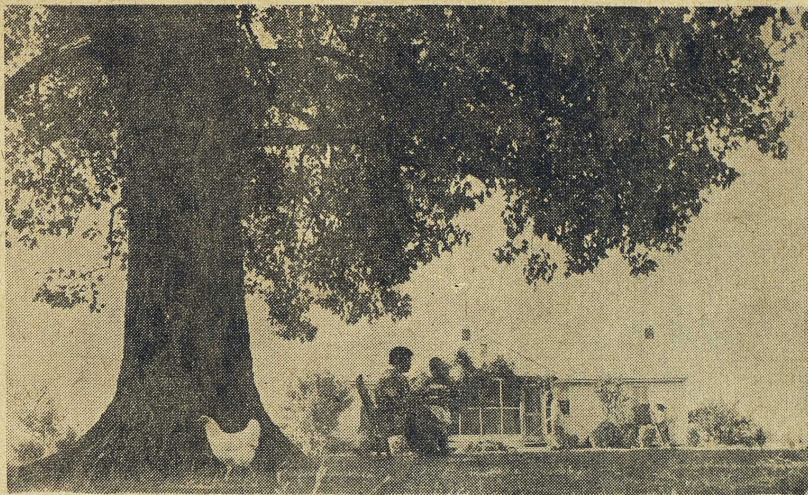
Negerfarmares gård i Mississippideltat. Ägorna omfattar 24 hektar.

Då deltat koloniserades för bortåt 150 år sedan var det inte, skriver Percy, av vanliga invandrare från Europa och Östern, utan av "slavägare och deras slavar". Den rika slätten var ett land för aristokrater och deras mänskliga egendom, medan "de fattiga vita" fick bosätta sig bland kullarna och bergen öster och söder om deltat. Här möter en distinktion av utom-