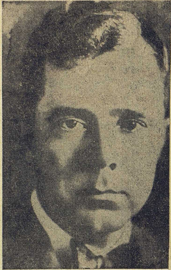
Huey Long: På bilden ovan vid 35 års ålder som nybliven guvernör 1928, till höger 1935, det år han mördades.

Huey Long var son till en jordbrukare i den övervägande av vita farmare bebodda norra delen av staten; fadern var tämligen välmående, men framställdes gärna av sonen som utfattig. Vid nitton års ålder gifte sig Huey, vid 21 tog han — trots ytterst torftig skolundervisning — en juridisk examen och praktiserade några år med framgång som advokat. Som så många andra amerikanska småstadsadvokater slog han sig på politik, valdes av det helt dominerande demokratiska partiet till mindre befattningar och vann år 1920 en viss ryktbarhet genom en aktion för högre taxering av ett telefonbolags inkomster. Vid trettio års ålder tävlade han för första gången utan framgång om guvernörsposten. Den politiska linje han sedan ständigt följde var redan klar; den innebar ingenting nytt, men drevs med ovanlig skicklighet och lidelse. Huey Long var de fattiga böndernas beskyddare mot kapitalisterna, monopolisterna, korruptionen och fördärvet i det rika och syndiga New Orleans. Han liknade i ett berömt tal Louisianas folk vid Longfellowns Evangeline, som förgäves väntar på sin älskade. "Var är de skolor som ni har väntat på för era barn och som aldrig kommit? Var är de vägar som ni givit pengar för att få byggda, men som aldrig blir färdiga? Var är de institutioner som behövs för de sjuka och vanföra? Evangeline grät bittra tårar i sin förtvivlan. Men hennes tårar varade blott ett liv. Edra tårar har flutit under generationer. Giv mig en möjlighet att torka dessa tårar."