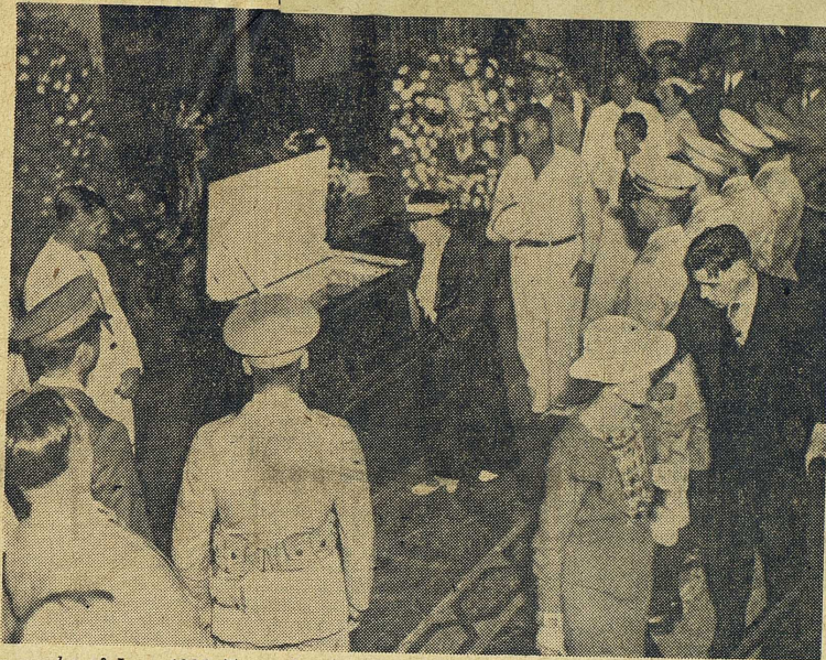
Efter mordet på Long 1935. Tusentals människor defilerade förbi den forne diktatorns kista i Louisianas Capitolium.

Slitningarna på sommaren 1932 blev påfrestande. Huey Long, installerad i en stor svit på Waldorf-Astoria i New York, begärde av Farley — som hade tillgång till valkassan — att ett extratåg skulle ställas till hans förfogande för en propagandaresa genom alla