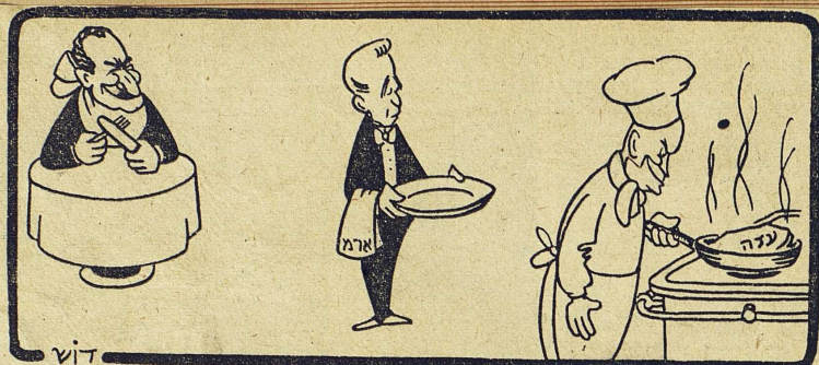
ויט Den mest kände karikatyrtecknaren i Israel, Desk, ger sin syn på Gazauppiggörelsen. Eisenhower tillreder steken — Gaza — och hovmästaren Hammarskjöld står redo att servera den väntande Nasser.