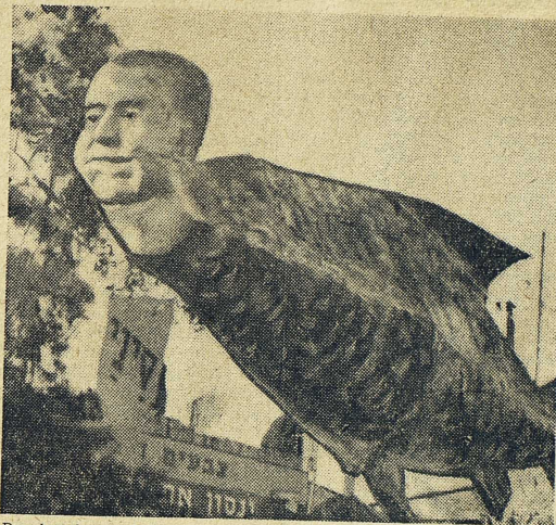
Dag betyder på hebreiska fisk, och i skepnad av en karp förekom FN:s generalsekreterare ofta i de israeliska karnevalstågen nyligen.

Av de tre aktuella tvistepunkterna — rätt till skeppsfart genom Suez, rätt till skeppsfart genom Akabavi- ken till Israels hamn Eilat samt för- valtningen av Ghaza — är Ghazaom- rådets ställning den dominerande frågan. Suez och Akaba är frågor om materiella intressen och här finns starka förhoppningar om att Israels krav skall vinna gehör; vad beträffar Akaba har dessa förhoppningar stegrats nära nog till visshet genom Saud-Arabien's förklaring att de små öarna i bukten inte skall brukas för blockad av till och från Eilat kommande fartyg. Ghazafrågan gäl-