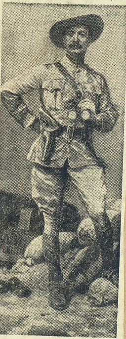
General Baden-Powell — efter en teckning av R. Caton Woodville i The Illustrated London News.

Den populära föreställningen om boerkriget nu för tiden — i den mån det finns någon föreställning om saken — är väl att det ännu maktlystna och rovgiriga England