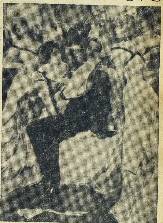
Herbert Tingsten skriver i denna artikel om undsättningen av den belägrade staden Mafeking under boerkriget och de våldsamma glädjedemonstrationer som nyheten därom utlöste i England. — Bilden ovan till vänster är en teckning ur The Graphic den 25 maj 1900 med glädjetumultet i Portsmouth. Bilden till höger — hjältens återkomst från slagfältet — är hämtad ur The Illustrated London News från samma tid.

kriget var för länge sedan klart; Roberts och Kitcheners arméer hade tillfångatagit boernas största förband under Cronje, hade erövrat Oranje-ristatens Bloomfontein och närmade sig Tranvaals Pretoria. Det hade inte mycket värde att den lilla staden Mafeking, med några tusen invånare och mindre än 1 000 mans besättning, befriades från belägring. Och kriget var inte slut med detta, det skulle fortsätta ännu drygt två år.