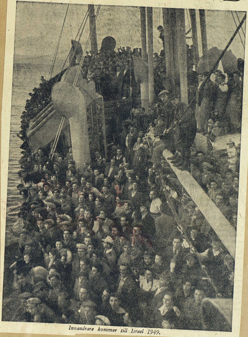
Invandrare kommer till Israel. 1949.