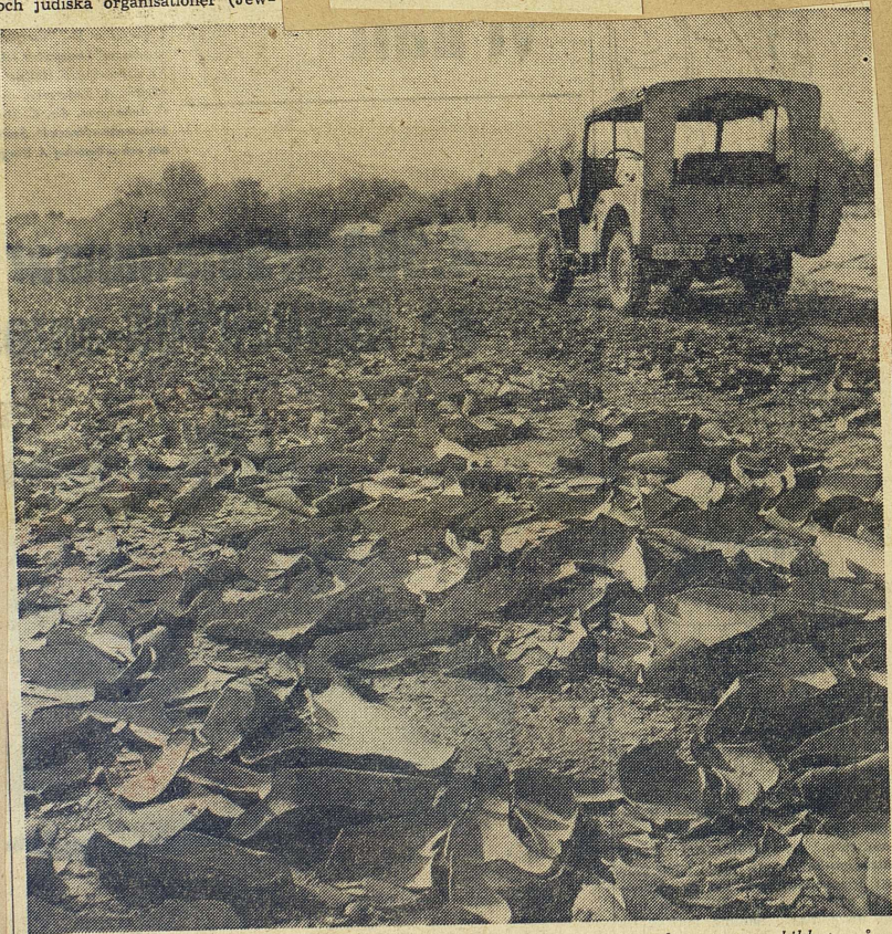
Negeböknen efter störtregn och efterföljande torka. Bilden är tagen i närheten av en kibbutz några mil från Beilab, vid Röda havet. Genom invallning och kontinuerlig vattentillförsel kan områden sådana som detta bli fruktbart mark.

Men det finns, försäkrar riks- bankschefen och andra experter, gott hopp om en stabil och tryg- gad ekonomi för framtiden. In- vesteringarna uppgår till 40 pro- cent av nationalinkomsten — två till tre gånger så mycket som i Västeuropa, och det innebär att möjligheten till produktion och export växer med utomordentlig snabbhet. Man pekar på att ex- porten — av citrusfrukter, av be-