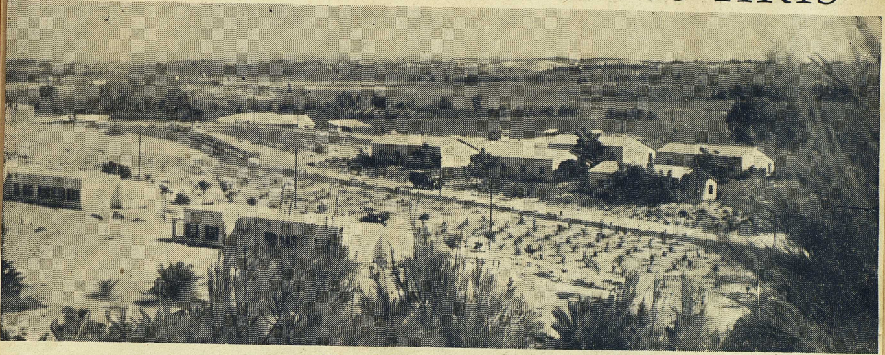
Kibbutzen Jad Mordechai vid gränsen till Ghaza.