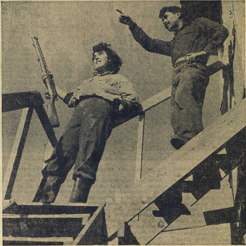
På vakt i en kibbutz.

Israels snabba och fullständiga seger över arabstaterna ledde till att Israel enligt vapenstilleståndsavtalen 1949 fick ett avsevärt större område än som avsetts, däribland en del av Jerusalem. På visst sätt en stor fördel för den nya staten var också att en stor del av araberna inom detta område (500 000—600 000) flydde före och under kriget och att judarna alltså fick överväldigande majoritet. Varför denna massflykt ägde rum kan inte helt klarläggas. Delvis var orsaken utan tvivel skräck för judiska våldshandlingar. Det finns visserligen intet tvivel om att arabernas krigföring var hårdare och grymmare än Israels; där araberna segrade var totala massakrer segerns följd, och inga judar överlevde i de områden som föll i arabernas händer.