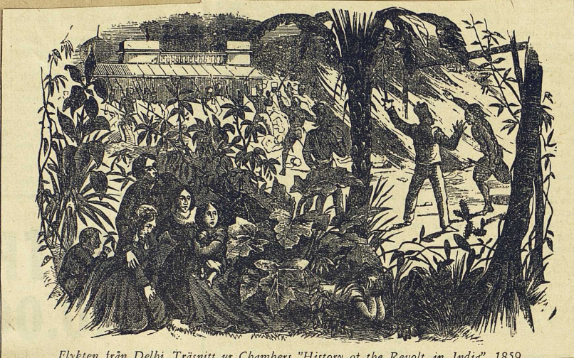
Flykten från Delhi. Träsnitt ur Chambers "History of the Revolt in India" 1859

je "ett uppror av reaktionära intressen mot en regim som sökte att reformera gamla institutioner". Dessa karaktäristiker har ett gemensamt: man tar avstånd från tanken att här föreläggas ett nationellt indiskt uppror mot det engelska styret.