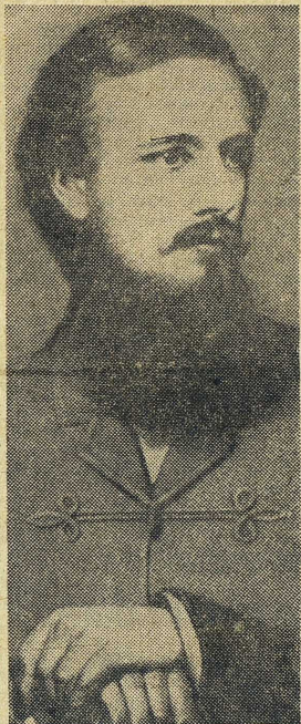
Generalen sir John Nicholson, erövraren av Delhi.

det var rättfärdigt och nödvändigt att hålla denna "opålitliga ras" under sitt styre och att upproret alltså stimulerade den doktrinära imperialism som på 1870- och 1880-talen vräkte undan de tidigare tendenserna att se kolonierna som en börda eller som föremål för uppfostran till självstyrelse. Överlägsenhetskänslan mot indierna och särskilt mot hinduerna växte i England, har det påståtts; klichétänkandet om indisk oförmåga och indisk lömskhet blev mera förhärskande än förut, och en historiker har rent