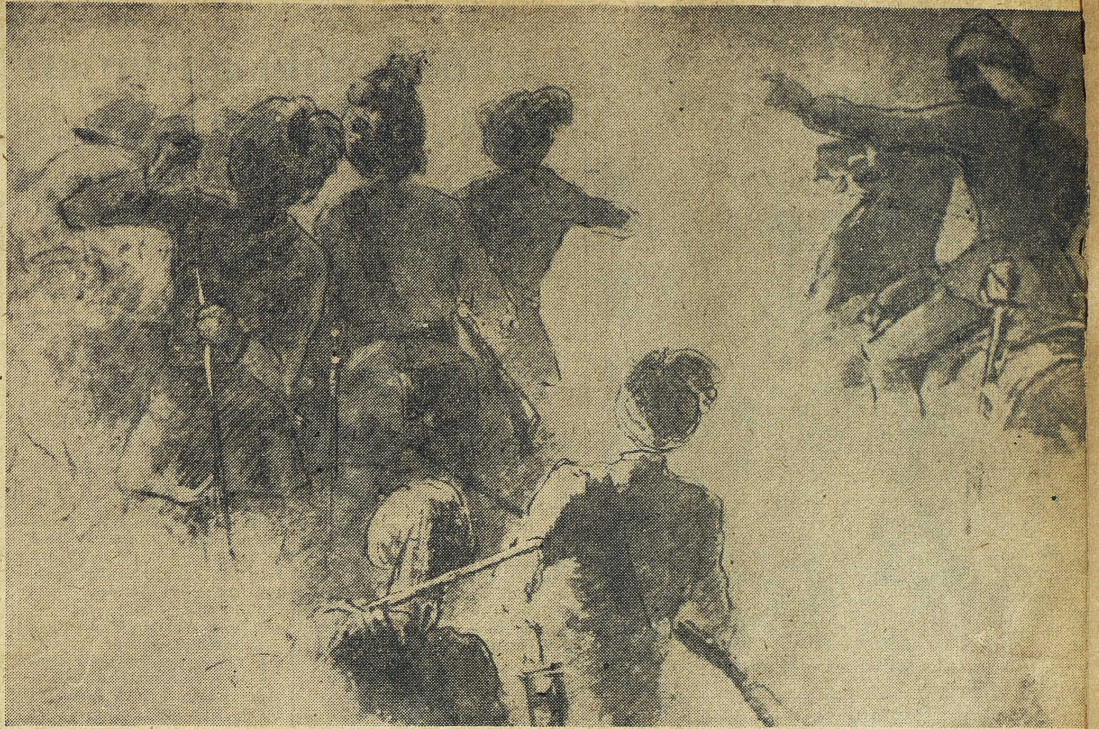
Engelska trupper förföljer sepoy i slaget vid Doondiakera. Sepiateckning av Egon Lundgren.

Att Cawnpores garnison döddes trots löfte om fritt avtåg är ostridigt. Men redan i en rad böcker som kom ut ett eller ett par årtionden efter upproret (G O Trevelyan, Kaye) klarlades att varken Nana sahib eller sepoy var ansvariga för nedslaktandet av de två hundra kvinnor och barn vilkas lik påträffades i en brunn; tvärtom hade sepoy vägrat, då en av Nana sahibs underlydan-