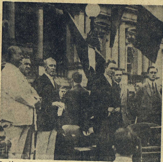
President Wilson talar på Flaggans dag i Washington 1913. Längst till vänster står utrikesministern, William J Bryan, i mitten presidenten och längst till höger biträdande sjöministern i Wilsons regering, Franklin Roosevelt.

Detta är inte en triumfens dag; det är en invigningsdag, förklarade Wilson i slutet av sitt installationstal den 4 mars 1913. "Detta är en dag av nationell helgelse", var Roosevelts första ord i installationstalet tjuu år