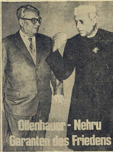
Ollenhauer - Nehru Garanten des Friedens