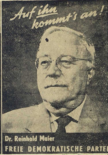
Dr. Reinhold Maier FREIE DEMOKRATISCHE PARTEI

Västtyska valaffischer med de tre främsta partiledarnas porträtt. Till vänster förbundskansler Adenauer, vars paroll är "inga experiment", i mitten socialdemokraten Ollenhauer, vars prestige man söker höja genom att avbilda honom tillsammans med Nehru, och till höger de fria demokraternas ledare Reinhold Maier.