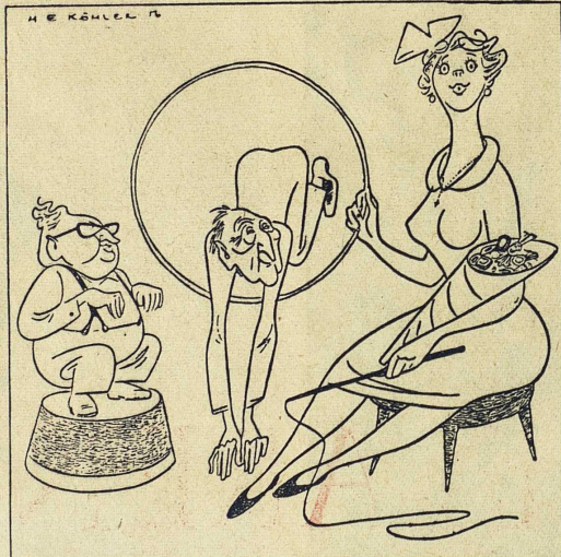
Skämtteckning som vill visa hur Adenauer och Ollenauer gör konstner för att uppnå vackra resultat vid opinionsundersökningarna.

än socialdemokraternas. Regeringen har under den senaste tiden stärkt sin position, dels genom inrikespolitiska reformer, såsom vårens pensionslag, dels genom att vad som skett i utrikespolitiken — avspänningsillusionismens sammanbrott, Ungern, de ryska ledarnas uttalanden — diskrediterat oppositionens kritik av Adenauers klara anslutning till Västern.