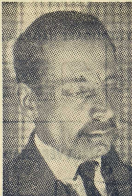
Rilke i Paris 1925.

I denna brevsamling, som omfattar åren 1921—1926, finns liksom i andra brevsamlingar från samma tid åtskilliga bevis på att Rilke länge bevarade sitt gamla förakt, sin gamla fruktan för politiken. Han är bosatt i Schweiz, en fristad för opolitiska likaväl som för de farligt politiska, och då han skriver om sin längtan till Paris skriver han också att han skall "flanera på kajerna och i Luxembourg utan att någonsin