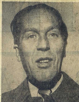
Dessa porträtt av försvars- och utrikesministrarna samt överbefälhavaren får illustrera den första i en serie ledare med anledning av den nu framlagda ÖB-planen för vårt försvar. I dagens artikel diskuteras analy-

Men låt oss inte stanna vid denna ostridiga sats, utan gå in på ÖB:s huvudlinje om Sveriges krigsrisk i samband med ett storkrig. Här deklarerar att det är möjligt "att vi inte blir inordagna däri, åtminstone i dess inledningsskede, om vi har ett försvar som gör att vi inte snabbt kan betvingas". Detta är oemot-