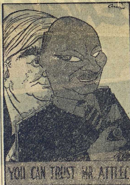
Bevan maskerad som Attlee, en bildkommentar av den konservativa Daily Express till en av labours valaffischer. Så frän som i detta fall var sällan propagandan inför 1955 års engelska val.

Som tidigare konstateras att kandidaternas kvalifikationer och insatser är av ringa betydelse. "Ingen kandidat är värd 500 röster", denna tes blev i stort sett bekräftad 1955. Tendensen är i nästan alla valkretsar densamma, oberoende av om en förstklassig högerman ställs upp mot en obehörig labourkandidat eller tvärtom. Detta innebär att majoritets-