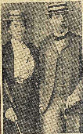
Nygifta: Stanley Baldwin och hans hustru 1892.

stå lägre. Vid flera tillfällen erkände Baldwin att han sagt eller gjort något galet, men denna öppenhet stördes av en självgodhet som gjorde erkännandet vida viktigare än felet — det är övermänskligt att erkänna, men mänskligt att fela, syntes vara summan av resonemanget. "Jag är alltid redo att be om ursäkt då jag gjort ett misstag... Om jag sagt detta (ett oriktigt uttalande som tillskrivits Baldwin), erkänner jag att jag hade fel... Jag vill bara uttrycka den fromma förhoppningen att mina motstän-