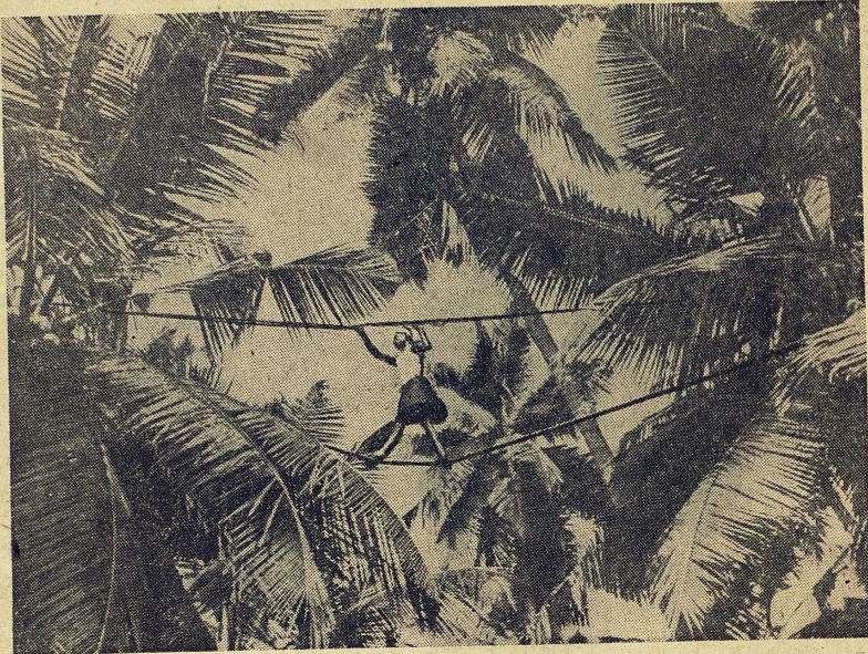
Ur Ceylons näringsliv: kokospalmerna skattas.

I RESEBESKRIVNINGAR och handböcker om Asien skildras Ceylon med entusiasm som "ett stycke jade i det turkosblå havet", "Asiens pärla", "den gröna ön". Det är väl främst kontrasten mellan det förtorkade Sydindien och Ceylons frödighet, vatten och friska vindar som format den synen. Den stora turisttrafiken förklaras främst av att över halva kusten är underbar badstrand, skyddad för storm och hajar av ett sammanhängande rev ett par kilometer utanför. En annan attraktion är den gamla huvudstaden Kandy uppe bland bergen i centrum med tempel, färgstarkt klädda infödingar och tryggt arbetande elefanter — att äga en elefant för uthyrning är en idyllisk form av kapitalism. Detta Ceylons Dalarna smyckas också av forminnen och legender. Berget Adam's Peak betraktas av motsatta skäl som heligt av buddister, kristna, muhammedaner och hinduer; här finns märket av Buddhas fot, och här grät Adam och Eva ihop en sjö, sedan de drivits ut ur paradiset.