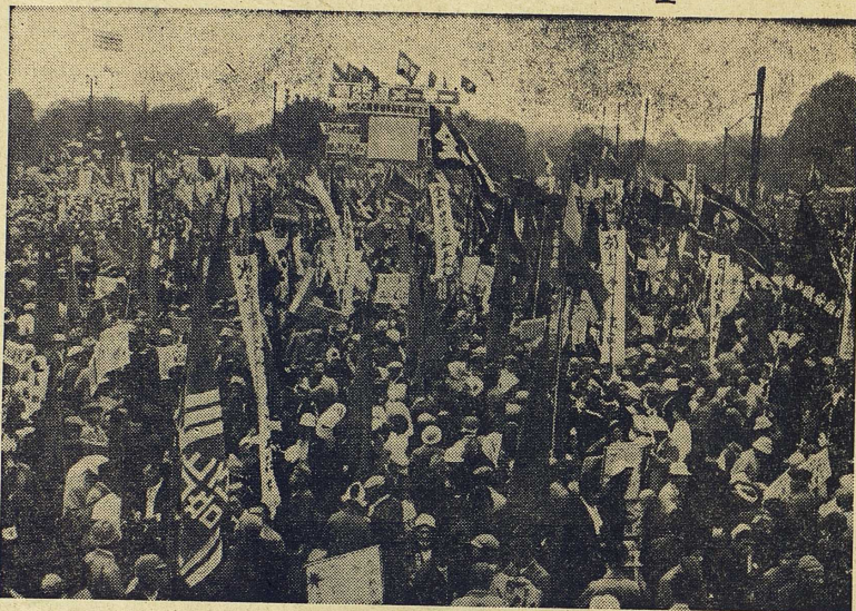
Majdemonstration i Tokyo.

Emellertid har, om man ser till huvudriktningarna, den japanska politiken varit relativt stabil, även om positionerna inte varit så fastlåsta som i några av Västeuropas demokratier. Enklast kan saken uttryckas så att liberaldemokraterna och deras föregångare alltid haft klar majoritet, i regel nära två tredjedelar av rösterna och mandaten, medan socialdemokrater och kommunister tillsammans haft mellan en fjärdedel och en tredjedel. Procentsiffrorna är för rösterna vid de fyra senaste valen mellan 59 och 66 procent (liberaldemokrater), mellan 24 och 31 procent (socialister). Kommunisterna nådde sin kulmen vid valet 1949, då missnöjet med ockupationen började bli starkt och de ekonomiska svårigheterna efter kriget ännu var trängande; partiet fick då 10 procent av rösterna, men har sedan växlat mellan två och tre procent. Efter 1955 års sammanslagningar är läget tills vidare enkelt och klart, med den liberaldemokratiska eller konservativa majoriteten och den socialdemokratiska minoriteten som helt dominerande riktningar.