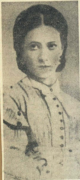
Tolstojs bustru Sofia Andreevna vid tiden för deras giftermål 1862.

Att Tolstoj vid romanens utarbetande inte gjort närmare bekantskap med dessa historiefilosofier synes emellertid främst framgå därav att han inte alls berör