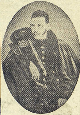
Tolstoj som tjugosjuårig officer 1855.

nebar det en välgörande reaktion mot en historieskrivning som blomstrade särskilt i 1830- och 1840-talens Napoleonromartik. Men det är klart att Tolstoj går till överdrifter i sin argumentation och i sin uppfattning om ledarnas betydelselöshet. Att viljan inte är fri — ett filosofiskt-terminologiskt problem, som strängt taget inte hör hit — hindrar inte att den vilja ledaren ger uttryck åt kan vara bestämmande för andra, att en befallning inte åtlöds