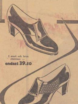
I svart och brun chevron, endast 39.50

Lisa-sko är en fantastisk sko som för alla damer som behöver en så där extra bekväm och rymlig sko. Den är utformad för att ge dig maximal komfort och stöd under hela dagen. Den har en mjuk innersula och en stabil sål som hjälper dig att stå i långa stunder utan att bli trött.