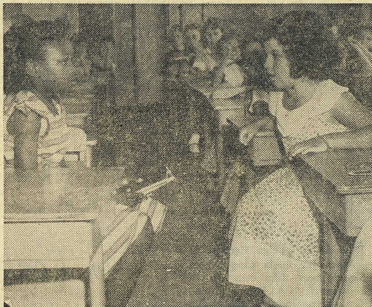
För första gången i Södern sitter en negerelev i samma klassrum som vita skolbarn (Fort Myer, Virginia, hösten 1954).

30 år, kanske 1975. Så snabb har utvecklingen varit. Här skall jag blott med några ord stanna vid vad den inneburet. All segregation, allt särhållande i mellanstatlig samfärdsel har undanröjts; så snart en järnväg eller en busslinje berör flera stater måste vita och svarta behandlas utan diskriminering. Detsamma gäller hela militärväsendet, där integrationen systematiskt genomförts efter 1951; 4.000 av arméns 114.000 officerare är negrer. Ett växande antal stater och städer har antagit effektiva bestämmelser mot särskiljande och privilegiering; till och med inom privata företag måste man anställa personer utan hänsyn till ras och färg. En neger som söker plats i ett bolag men blir förbigången, som besöker en restaurang, men blir avvisad eller dåligt upppassad, som hänvisas till särskild plats på en bio eller i en teater, kan enligt dessa bestämmelser få rättelse ge-