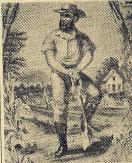
Präriejarmaren. Tryck från 1869.

Den demokratiska liberalismen har behärskat Amerika, självfallet och i stort sett utan allvarligt motstånd; det har inte funnits någon feodalism eller någon systematisk konservatism och därför inte heller någon socialism; brytningarna har i det hela varit ojämförligt mindre än i Europa. Sådana är Hartz teser. Systemet