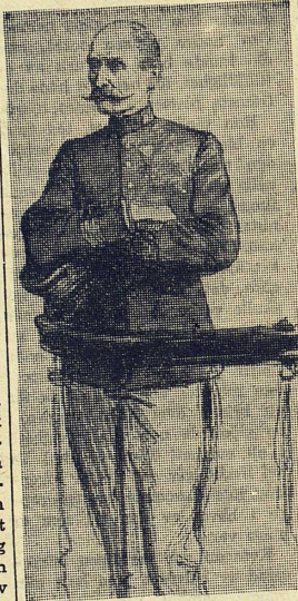
Major Esterházy vid Zola-processen.

liknande informationer dreyfusarder — blev svaret i den franska debatten ett hänskratt: "Jaså, Dreyfus får hjälp till och med av kaisern." En del generalstabsofficerare, främst överste Henry, fann det nödvändigt att direkt förbättra anklagelsesmaterialet genom förfalskningar. Det var snarast dessa