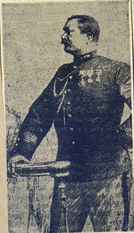
Överste Henry vid processen mot Zola 1898.

Efter domen och sedan kritik satt in blev det för militären och till en tid för nästan alla inblandade en hederssak att försvara vad som skett. Att alla indicier mot Dreyfus saknades blev i detta sammanhang snarast en fördel. Det var nästan omöjligt för folk i allmänhet, i parlamentet, i pressen, att tänka sig att en hård dom fällts utan några som helst sakskäl; intellektuellt var detta en orimlighet, känslomässigt var det så obehagligt att man värjde sig mot insikten. Myndigheterna, från regeringen till generalstaben, blev länge trodda då de talade om ett "absolut" bevis som var alltför farligt från utrikespolitisk synpunkt för att kunna offentliggöras, om bekännelser av Dreyfus som måste hållas hemliga. Då kejsar Wilhelm meddelade den franska regeringen att Schwartzkoppen aldrig haft att göra med Dreyfus — Europas furstar blev genom