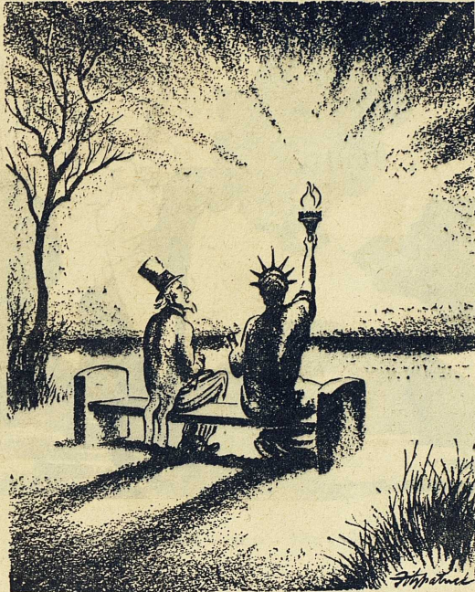
Onkel Sam till Frihetsgudinnan: Alla är en smula subversiva, utom du och jag — och ibland tror jag att till och med du... (Teckning i St. Louis Post-Dispatch.)

Det har beräknats att omkring 12,6 miljoner personer, eller var femte medlem av den arbetande befolkningen, fått sin lojalitet prövad på ett eller annat sätt som villkor för sin anställning. Viktigast är den unionella lojalitetsprovningen, som omfattar omkring två tredjedelar av det angivna antalet personer: tjänstemän, militärer, anställda (omkring 2,4 miljoner) inom privata företag som producerar för unionens räkning. I de flesta delstater tillämpas ungefär samma ordning. Av lärarna inom högre och lägre undervisning (250.000 respektive 1.100.100) är det stora flertalet enligt statslagar eller styrelsebeslut underkastade särskilda lojalitetsföreskrifter; detsamma gäller i regel advokater, enligt juristorganisationernas stadgar. Flera privata företag har beslutat lojalitetsprovning, så General Electric Company och Bell Telephone System med hundratusentals anställda. Även författare, journalister, skådespelare och musiker är enligt beslut av det företag som anställer dem, och på grund av den bojkott som ofta anordnas mot misstänkta personer, i hög grad beroende av att deras lojalitet, vare sig genom särskild provning eller på annat sätt, står eller ställs utom tvivel.