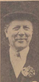
Export på gott uppförande: Harold Nicholson.

HAROLD NICHOLSON har avbrutit sin långa serie av briljanta hörspråk och politiska studier med en bok om vad som anses vara kärnkraft och belevnad under andra världskriget i olika länder. Good behavior (Conscience, 21 shilling). Här finns många sällsynta historiska uppteckningar för lekmanen på ett angenämt sätt. Nicholson följer det goda uppförandets historia från det gamla Kina och antiken Aten och Rom till 1940-talets tyska "Richtigkeit" och de engelska privatskolornas "moraliska ideal". Riktigt löst blir det dock inte. Nicholson äger i hög grad den hantverksliga klåhet som tar sig uttryck i färdiga och glädsvidva reflexor, men som snarast utelämnar systematik och tankesked. Tross bevis på betydande dilligt sätt genom tre eller fyra citat, verkar undantagen. Här regelns bevisas med ett eller två citat. Tross skänksvärda och på stor erfarenhet byggda försök att göra