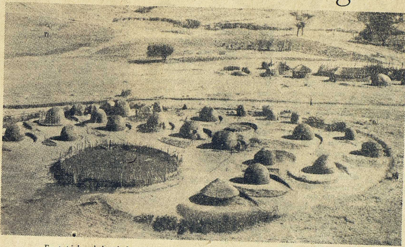
En typisk zulukraal, byggd i hästskoform och med en boskapskraal i centrum.

Beträffande de färgade och indierna skall endast anmärkas att de lever i städerna i ungefär samma omfattning som de vita och att de liksom de svarta stadsborna till större delen är industriarbetare.