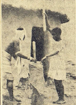
Krossning av majs till mjöl i en kral i Ciskei (inmill East London)

Men verkligheten i mera banal mening är en helt annan. Reservaten är snarast reservoarer för arbetskraft. En stor del av de vuxna männen, i vissa områden 50 procent eller mera, reser till städerna för att vinna arbete och utkomst. Den självstyrelse som beviljats på vissa håll är i det väsentliga illusorisk, då vita ämbetsmän har det slutliga avgörandet i sin hand. Avkastningen av jordbruket och boskapskötseln i reservaten är ytterligt låg, en tredjedel eller en fjärdedel av vad som utvinnes på